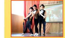
Фото выступлений участниц гимназического коллектива «Реглея» (панч «Зонтики») и лауреата городских вокальных конкурсов, победителя языкового фестиваля «Возрождение» школьного квартета «Парус» на конкурсе «Достоиния 2019»

Победы гимназистов – это, несомненно, победы и наших педагогов. Благодарим всех учителей, помогающих ребятам достичь высоких результатов!