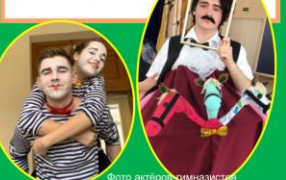
фото актеров гимназии