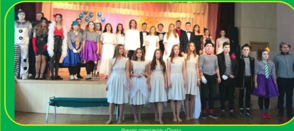
Финал спектакля «Поэт»

Ирина Викторовна, сценарист-постановщик, режиссёр спектакля.