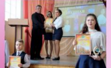
Награждение победителей и призеров конкурса