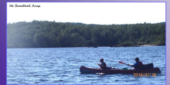
На Западной Лице